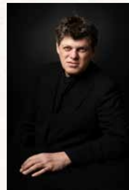
Guy Braunstein Director Artístico clasclás

Quero agradecer ao Concello de Vilagarcía de Arousa a súa aposta decidida polo festival; a todos os que traballan nel polo seu esforzo; aos meus colegas mentores e aos nosos xoves músicos por axudarme a achegarnos máis á nosa meta final: que o clasclás sexa unha cita esencial na axenda dos melómanos de todo o mundo e coñezan que nun belo recuncho das Rías Baixas faise música con calidade e paixón únicas.